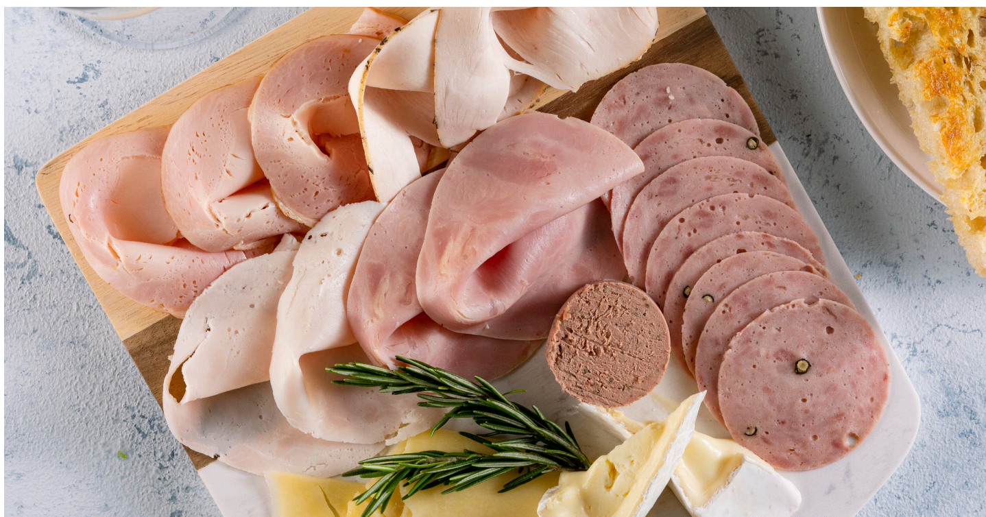
TABLA DELIPAVO PERSONAL

Pan focaccia, queso emmental, queso brie, pechuga de pavo mediterránea, rollo de pavo ahumado, salami de pavo, paté de hígado de pavo, pechuga de pavo y jamón de pavo - 44,000