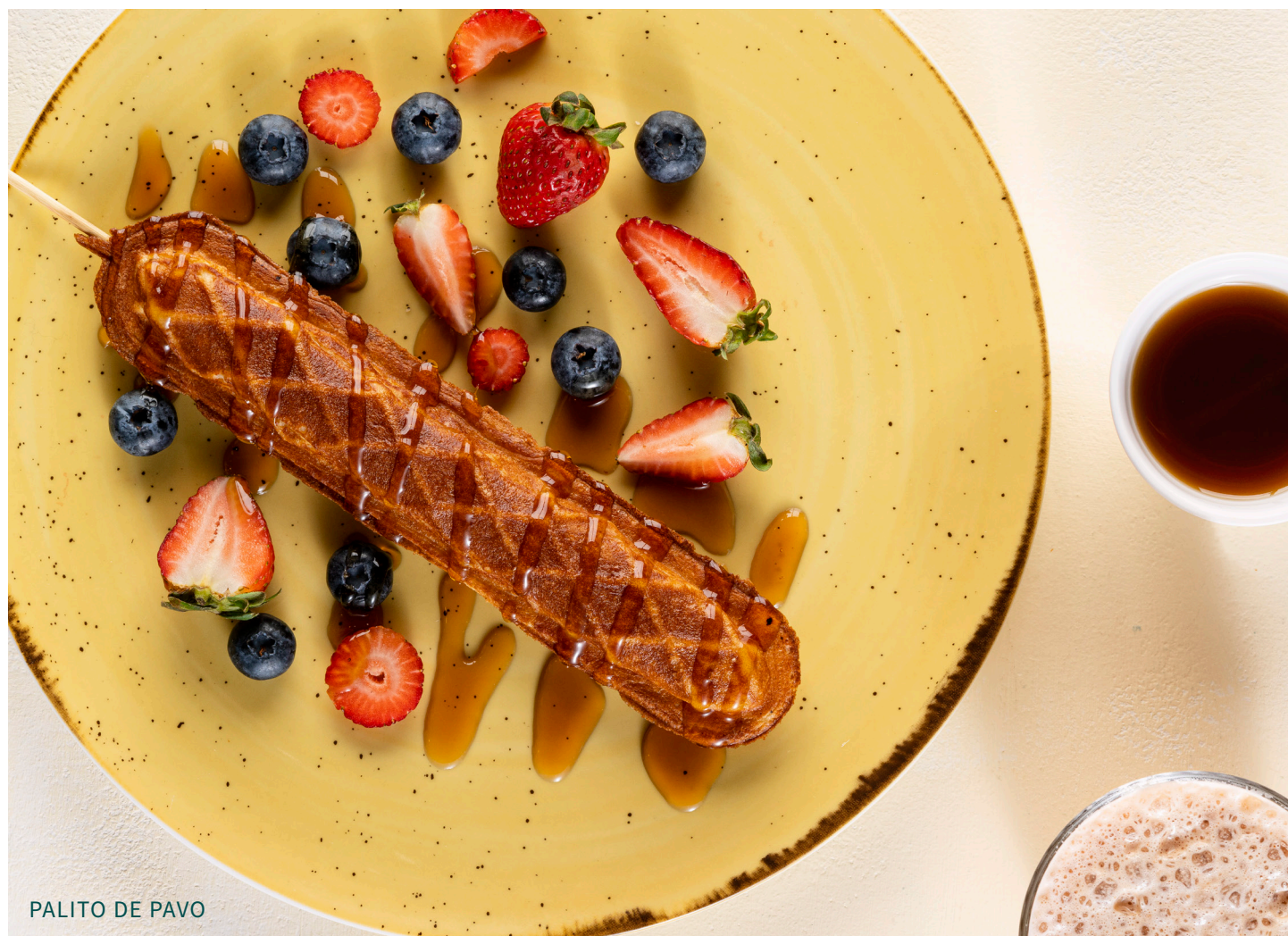
PALITO DE PAVO

Salchicha de pavo cubierta con waffle, acompañada de frutos rojos y miel de maple - 23,400